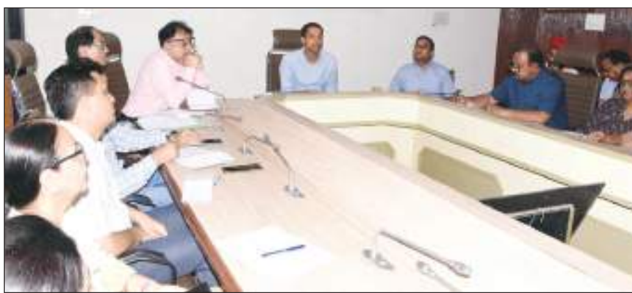
जाएगा। इस दौरान आयुष्मान भारत कार्ड के पात्रों को कार्ड वितरित किए जाएंगे। इसके बाद आने वाले दिनों सेवा पखवाड़ा, स्वच्छ भारत अभियान, रक्तदान, अंगदान की शपथ से जुड़े कार्यक्रम आयोजित किए जाएंगे। डीसी अनीश यादव ने कहा कि इस अभियान के तहत आयुष्मान मेलों का भी

करनाल/टीएम एक्शन इंडिया। डीसी अनीश यादव ने कहा कि 13 सितंबर को आयुष्मान भवः अभियान की शुरुआत होगी, जो 31 दिसंबर तक चलाया जाएगा। इस विशेष अभियान के तहत घर-घर तक पहुंच कर नागरिकों को स्वास्थ्य सुविधाओं व सेवाओं का लाभ देते हुए लाभान्वित किया जाएगा। उन्होंने कहा कि इस अभियान के तहत सेवा पखवाड़ा, स्वच्छ भारत अभियान, रक्तदान, अंगदान की शपथ, आयुष्मान आपके द्वार, आयुष्मान मेले और आयुष्मान सभा जैसे कार्यक्रमों का आयोजन किया जाएगा। अनीश यादव ने बताया कि अभियान की शुरुआत 13 सितंबर को राष्ट्रपति द्रौपदी मुर्मू द्वारा व राज्य स्तर पर राज्यपाल बंडारू दत्तात्रेय द्वारा की जाएगी। इसके साथ-साथ जिले की सभी सीएचसी, हेल्थ वेलनेस सेंटर, सिविल अस्पताल, कल्पना चावला मेडिकल कॉलेज, सब डिविजन अस्पताल में कार्यक्रमों का आयोजन किया